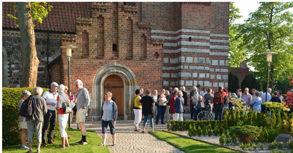
Fra rundvisningen ved Gladsaxe Kirke i foråret 2018

Husk, at tilmelding til arrangementerne er bindende. Ved forfald SKAL der meldes afbud.