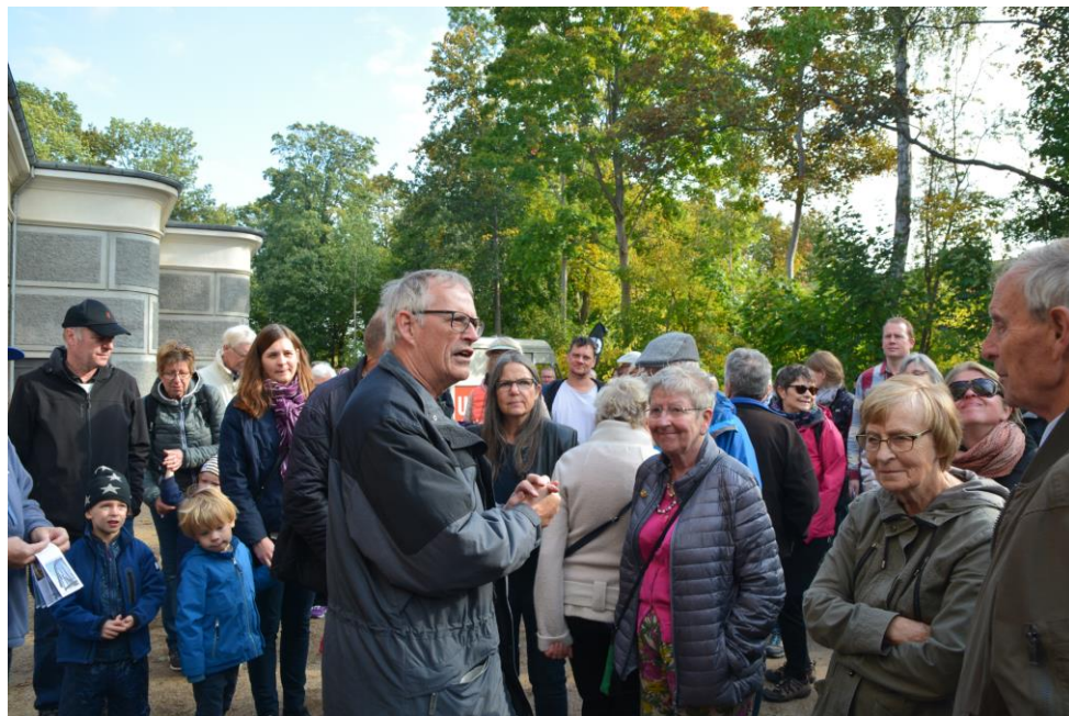
Fra genåbningen af Bagsværdfortet i efteråret 2018