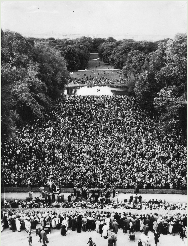
Alsangsstævne i Frederiksberg Have den 1. september 1940.

Tilmelding sker ved indbetaling til konto 1551-6483437 eller MobilPay 65 31 94 senest 1. maj. Ved overtegning tilbagebetales beløbet. Husk afsender.